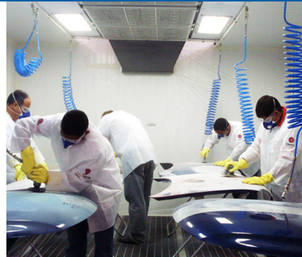
to Tintas em pó