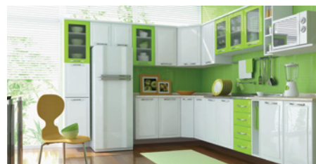
Móveis de aço, utensílios domésticos e eletrodomésticos