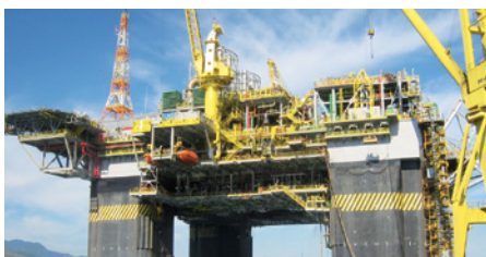
Marítimo e offshore