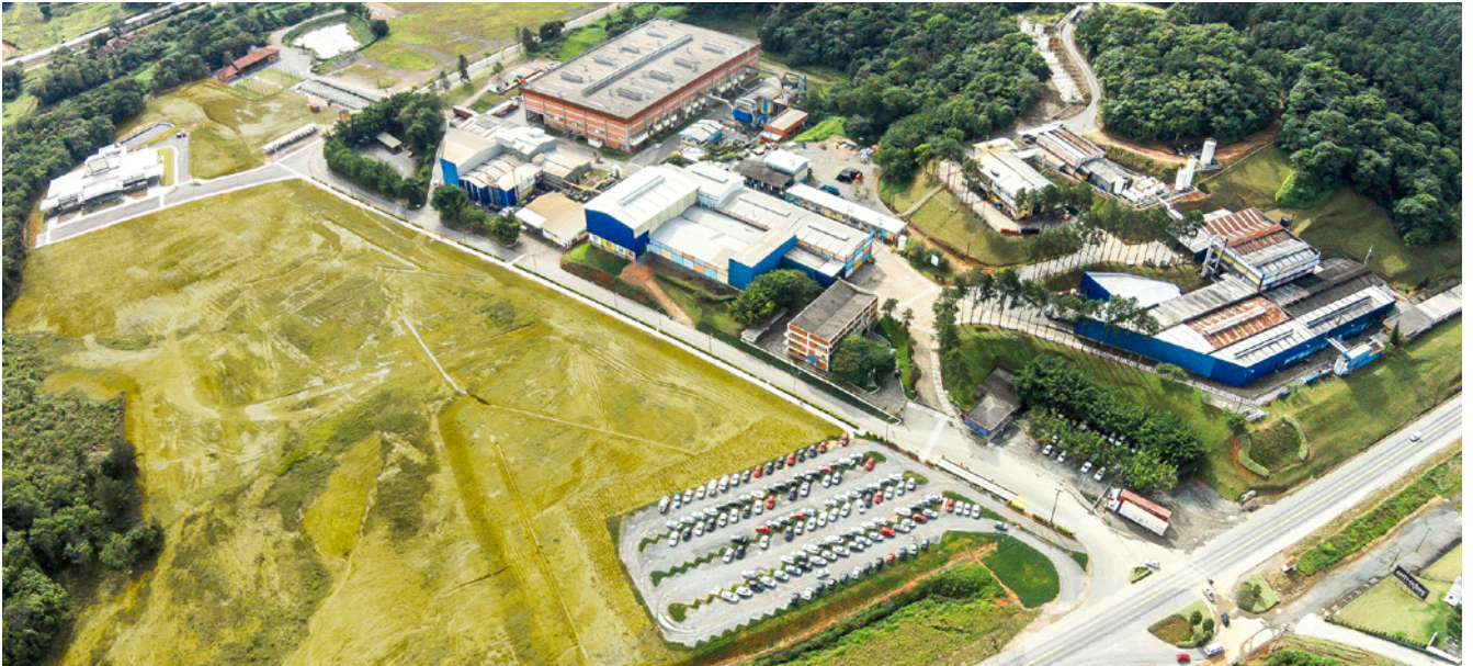
Matriz: Guaramirim (SC)