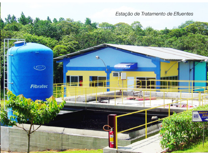
Estação de Tratamento de Efluentes