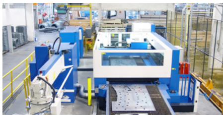
Máquinas e equipamentos, estruturas metálicas

Produtos adequados a cada aplicação, com excelente rendimento e ótima proteção contra corrosão.