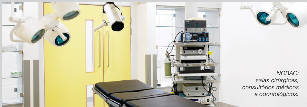
NOBAC: salas cirúrgicas, consultórios médicos e odontológicos.

As tintas WEG Nobac possuem propriedades antimicrobianas, fornecendo soluções confiáveis e de última geração para os casos onde higiene e saúde são fundamentais.