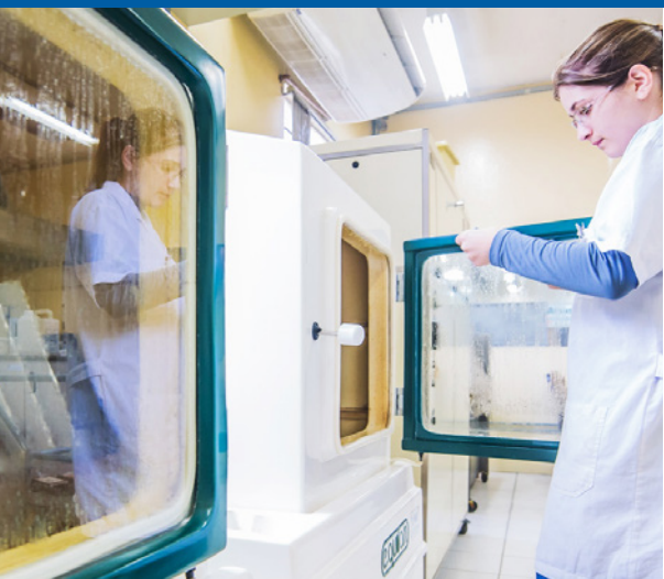
Laboratório de controle de qualidade e corrosão