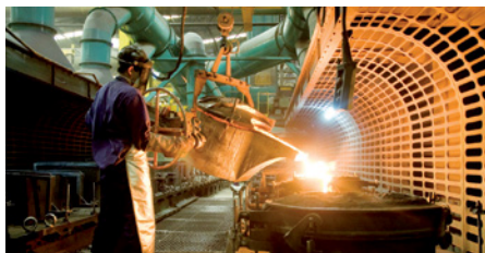
Fundições e siderurgias