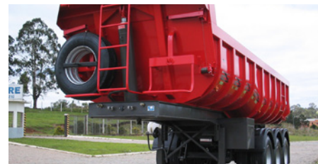
Implementos rodoviários, ônibus e frotas