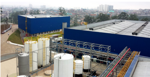
Filial: Paumar, Mauá (SP)