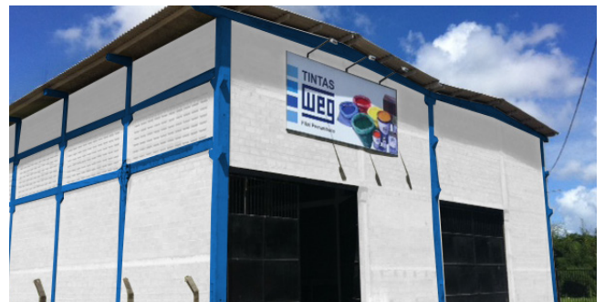
Filial: Cabo de Santo Agostinho (PE)