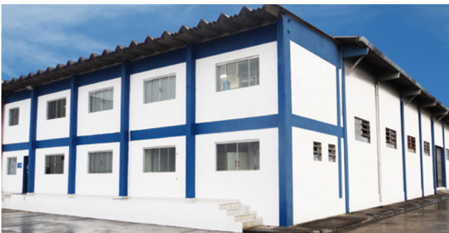
Filial: Mauá (SP)